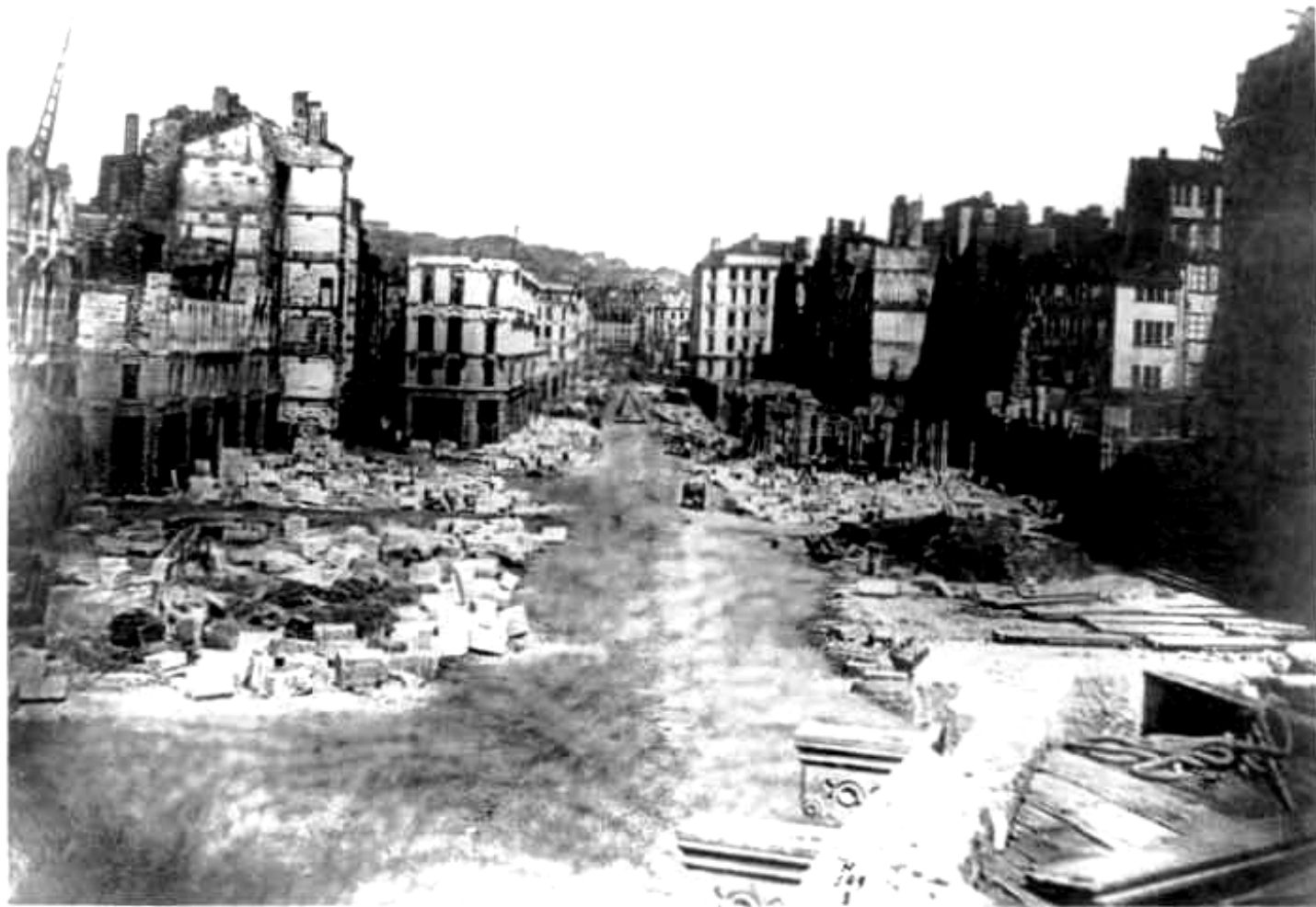
Lyon, percement de la rue Impériale, 1855.